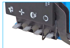
Podwójna prędkość obrotowa stołu, sterowana w pedale