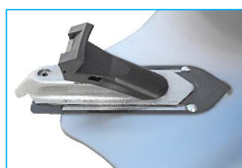
Dodatkowe ślizgi szczęk, oraz dysze inflatora