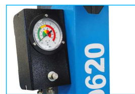
Metalowa skrzynka z manometrem