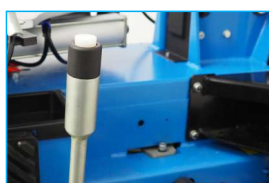
Zbijak sterowany przyciskiem