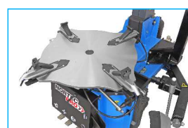
Profilowany stół montażowy od 10" do 30"