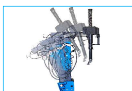
Pneumatycznie odchylenie ramię szersze u podstawy