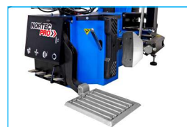
Mocny zbijak o sile 3 ton, widna do koła