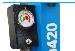
Metalowa skrzynka z manometrem