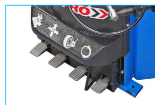
Podwójna prędkość obrotowa stołu, sterowana w pedale