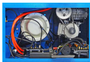
Wysokiej jakości podzespoły