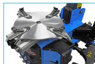
Profilowany stół montażowy od 10" do 24"