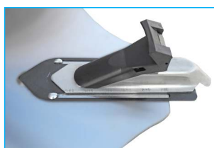
Dodatkowe ślizgi szczęk