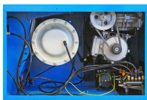
Wysokiej jakości podzespoły