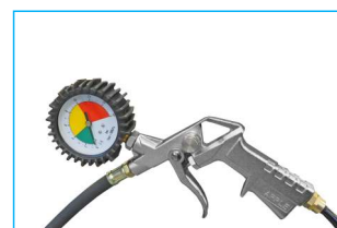
Pistolet do pompowania z długim wężem