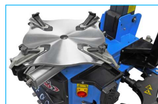
Profilowany stół montażowy od 8" do 24"