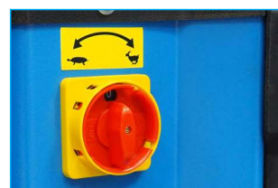
2 prędkości obrotowe stołu