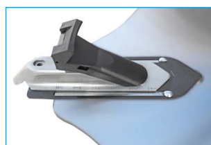
Dodatkowe ślizgi szczęk, oraz dysze inflatora