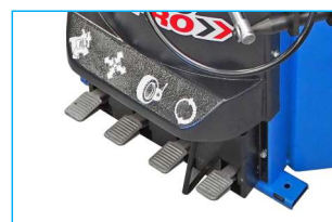
Podwójna prędkość obrotowa stołu, sterowana w pedale