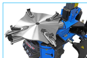
Profilowany stół montażowy od 10" do 26"