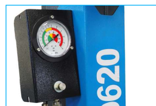
Metalowa skrzynka z manometrem