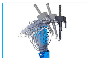
Pneumatycznie odchylenie ramie szersze u podstawy