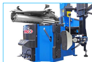
Mocny zbijak o sile 3 ton